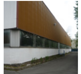
Abb. 5: Außenbereich vor der Modernisierung