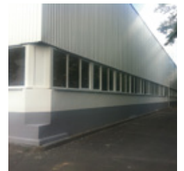
Abb. 6: Außenbereich nach der Modernisierung

Um die Akustik in der Halle zu verbessern, wurde eine neue Abhangdecke mit Schallabsorptionsfunktion eingebaut. An der Hallendecke wurde ein umfangreiches Tragwerk für haustechnische Leitungen und Anlagen installiert, sodass die spätere Produktion flexibel im Bereich der Halle versorgt werden kann. Der gesamte Sozial- und Verwaltungstrakt wurde komplett modernisiert. Es wurden alle Brandschutztüren ertüchtigt bzw. erneuert. Es wurde zum Teil eine neue Büroaufteilung angeordnet. Alle Räume erhielten eine neue Abhangdecke sowie einen neuen Anstrich. Im gesamten Sozial- und Verwaltungstrakt wurden die alten Bodenbeläge ausgetauscht. In Teilbereichen wurden Sanitärbereiche erweitert.