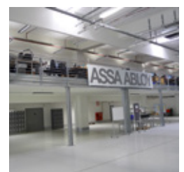
Abb. 3: Neu errichtete Galerieebene