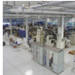
Abb. 4: Blick in den modernisierten Produktionstrakt