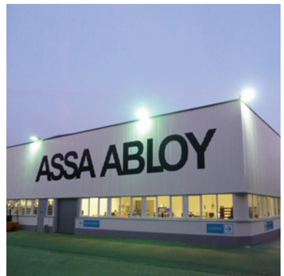
Abb. 1: Außenansicht der modernisierten Halle

Die ASSA ABLOY Group ist einer der führenden Hersteller von Schließsystemen in Deutschland und Europa. Im Werk Berlin werden Profilzylinder und Schlüssel produziert. Die SPECHT KALLEJA + PARTNER ARCHITEKTEN GmbH wurde beauftragt, den Umbau einer bestehenden 5.642 m 2 großen Lagerhalle in eine neue und moderne Produktionshalle zu planen und zu überwachen. In der Halle wird zukünftig eine Metallverarbeitung stattfinden. Die Produktion ist durch die Montage und Fertigung von Schlössern und deren Komponenten gekennzeichnet. Das Objekt verfügt in Teilbereichen über einen zweigeschossigen Sozial- und Verwaltungstrakt, der entsprechend modernisiert wurde.