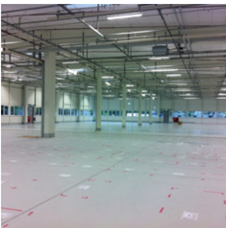
Abb. 8: Innenansicht der modernisierten Halle