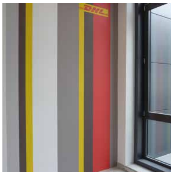
Abb. 1.: Fensteranschluss Treppenhaus

Hierzu fand zunächst die vollständige Entkernung der Etagen statt. Ein Großteil der Innenwände sowie sämtliche Unterdecken und Einbauten, wie Einbauschränke aus Stahlbeton, Innentüren, Bodenbeläge und sonstige Gebäudeinstallationen wurden ausgebaut.