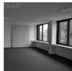
Abb. 2.: Großraumbüro Abb. 3.: Treppenhaus