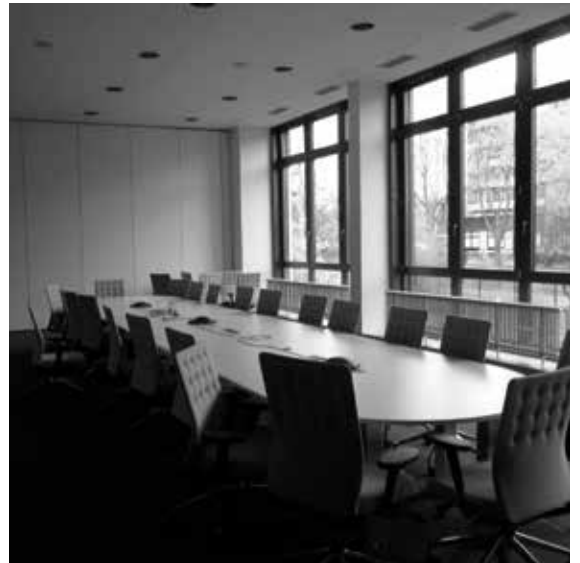
Abb. 4.: Sitzungssaal

Ferner sorgen zukünftig moderne Schallschutz-decken und Akustik-Wandabsorber für ein ge-sundes Arbeitsklima in den in Ihrer Größe vari-ablen Büro- und Besprechungsräumen. Zudem wurden die Treppenhäuser und Büroetagen durch den Einbau von Brandschutztüren und RWA-Anlagen im Sinne der aktuellen Brand-schutzbestimmungen ertüchtigt.